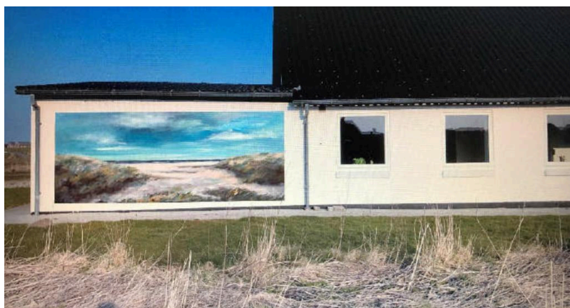
Illustration af det maleri, der ønskes malet på facaden.