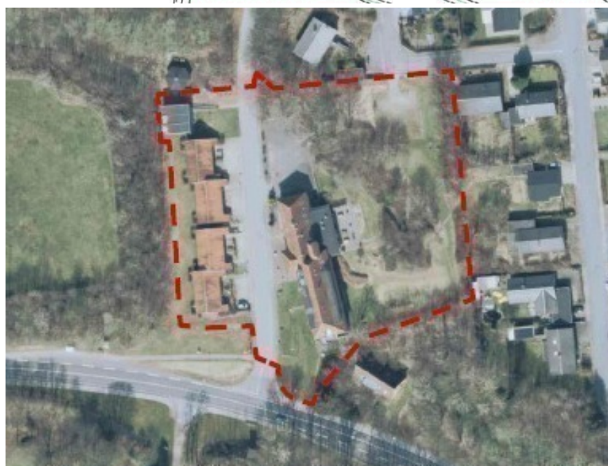
Lokalplanområdet fra lokalplanen kortbilag 2. lokalplanafgrænsningen.