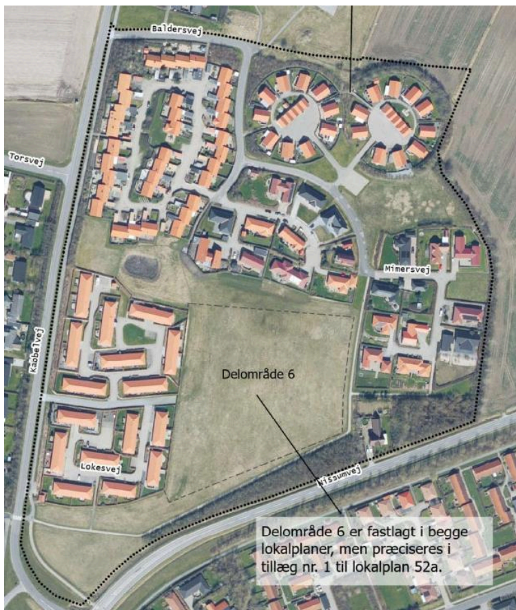
Placering af delområde 6.

Forslaget har været udsendt i offentlig høring i 8 uger fra den 22. december 2023 til den 15. februar 2024. Der er ikke indkommet indsigelser eller bemærkninger til planen.