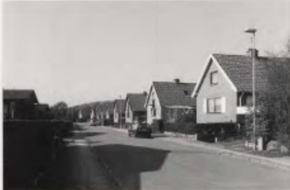
Hvis man kigger på de karakteristiske gavle langs Skrånten ses der en taktfast rytme, især fællestrekene i søforningen og materialerens enhed giver bebyggelsen et harmonisk helhedsbillede.

Den ene hustype ligger langs vejens ydre side med gavle ind mod vejen, mens den anden hustype ligger på oen i midten. De karakteristiske gavlprofiler, der gentager sig i en taktfast rytme, og den enkle bebyggelsesplan er velgørende og harmonisk.