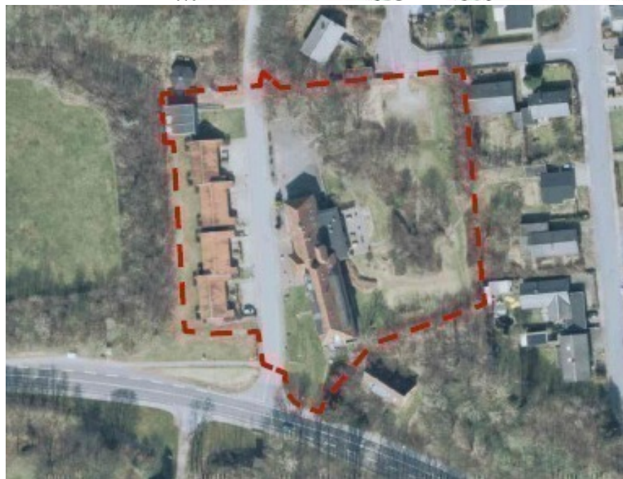
Lokalplanområdet fra lokalplanen kortbilag 2. lokalplanafgrænsningen.