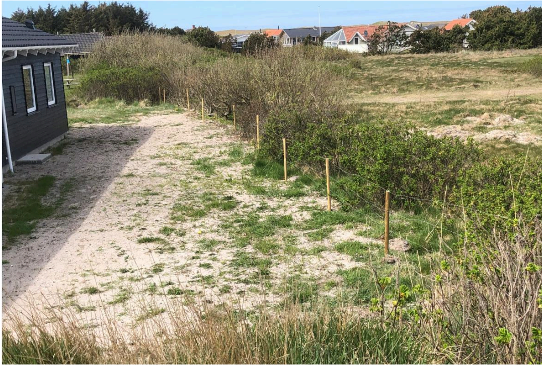
Tretrådet hegn langs med nordskel og ny beplantning på Fourmivej 8.

Naboer har klaget over det ulovligt opsatte hegn, som ikke er i overensstemmelse med bestemmelserne i gældende lokalplan 15. Administrationen har efterfølgende bedt ejer om at lovliggøre forholdet, som enten kan lovliggøres ved at det fysisk fjernes, eller retligt ved, at der meddeles dispensation til i en årrække at have det stående.