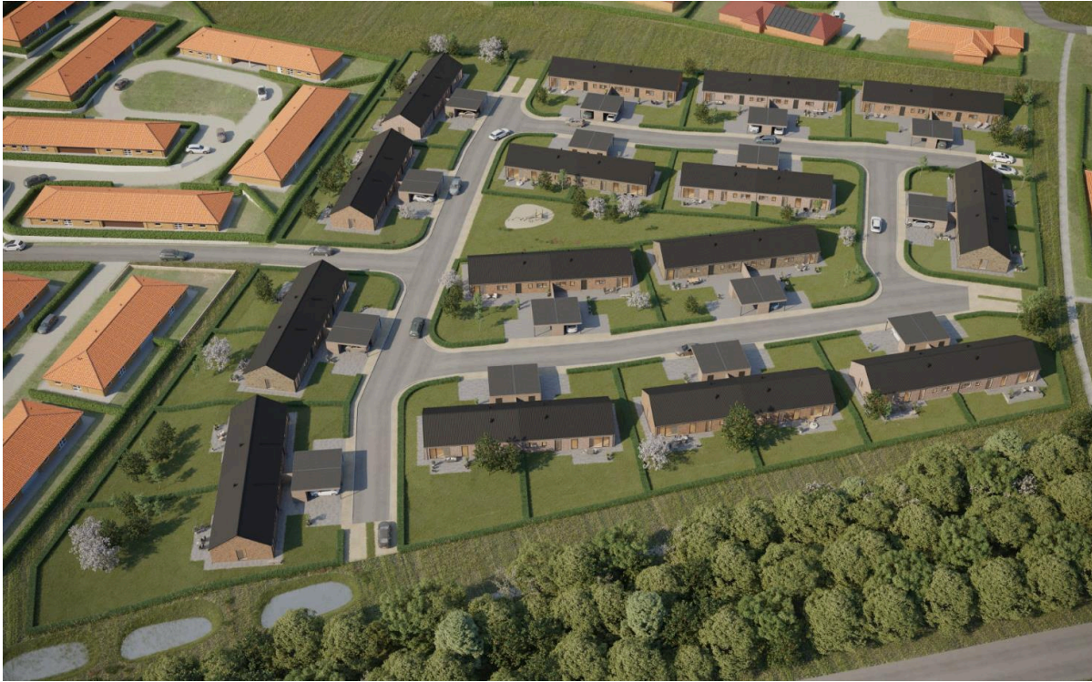
Visualisering af ny bebyggelse med nye dobbelthuse på Lokesvej.

I lokalplanen opstilles en række vilkår for opførelse af nye boliger i delområde 6. Der udlægges byggefelter, så boliger og carporte placeres systematisk, som bidrager til at skabe et harmonisk byggeri. I planen gives der mulighed for, at alle grunde kan bebygges med 15 dobbelthuse, 30 boliger i alt på ca. 120 m 2 , se illustration herover. Tillæg nr. 1 til Lokalplan 52a giver også mulighed for, at nogle af grundene kan udstykkes til opførelse af tæt-lav rækkehuse, hvor der kan opføres 9 dobbelthuse, 18 boliger samt 18 rækkehuse på ca. 80 m 2 . Der stilles krav om minimum grundstørrelse på 400 m 2 ved opførelse af dobbelthuse og minimum grundstørrelse ved opførelse af tæt-Lav rækkehuse. Desuden stilles der vilkår om, at boligerne gives et ensartet og harmonisk udtryk.