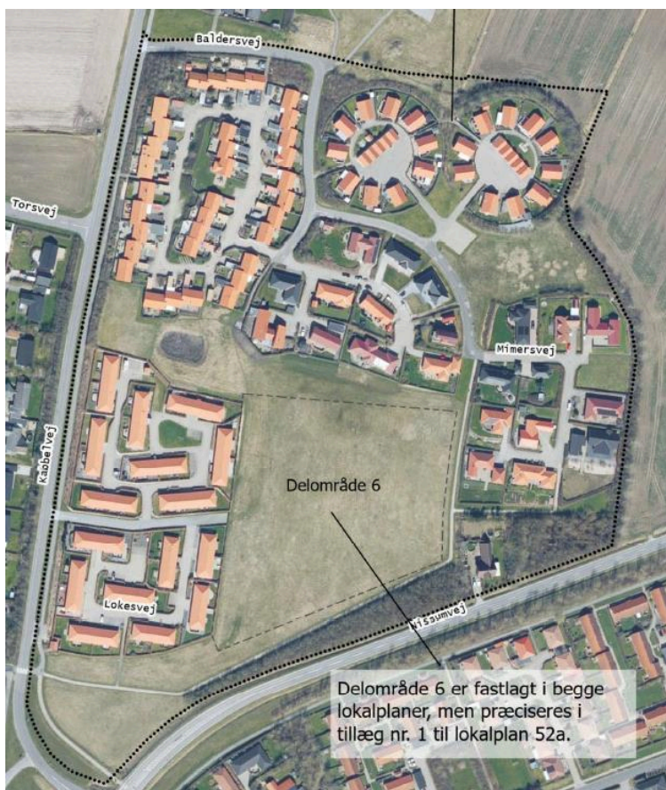
Placering af delområde 6.

Forslaget har været udsendt i offentlig høring i 8 uger fra den 22. december 2023 til den 15. februar 2024. Der er ikke indkommet indsigelser eller bemærkninger til planen.