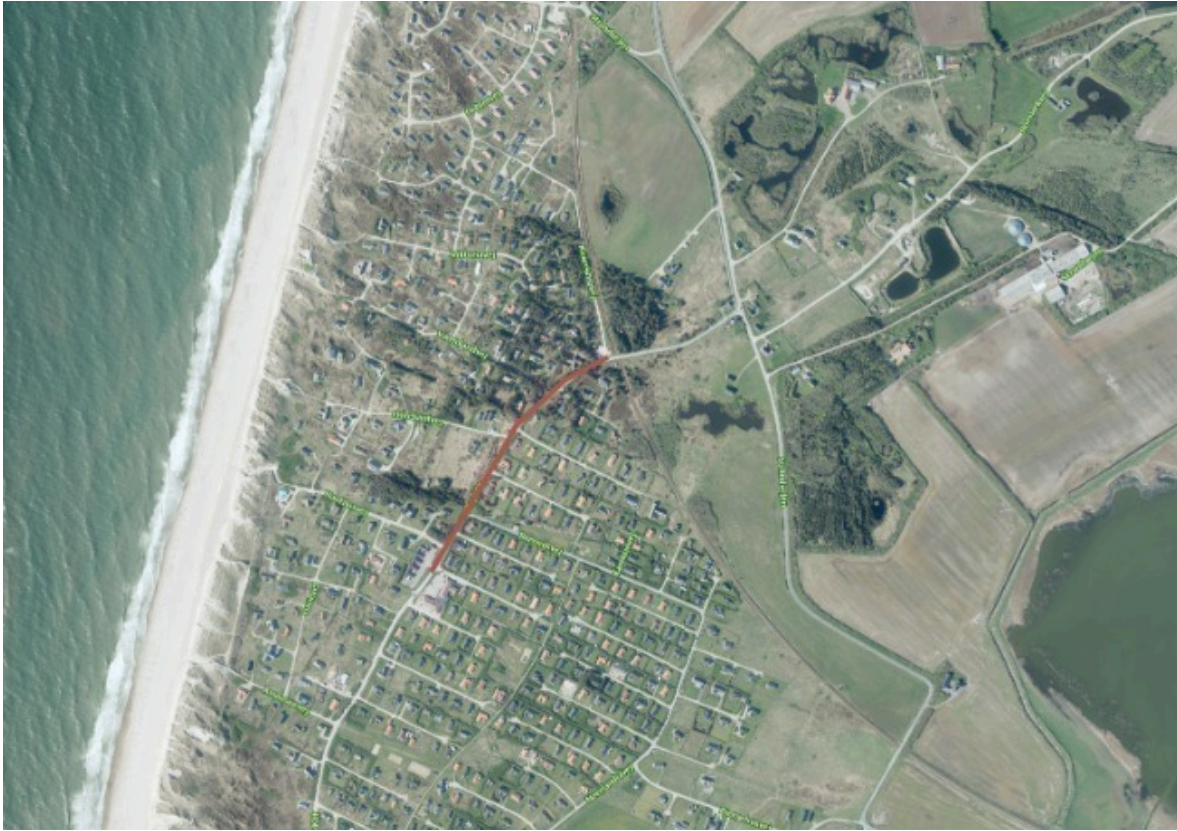
Den røde markering på kortet viser udstrækningen af projektet på Vejlbj Klit, fra Victoria Street Station i nord til Torvet mod syd.